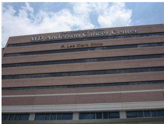
Clark Clinic (外来病棟)。M.D.アンダーソンは、テキサス・メディカルセンターの中にあつて、Alkek Hospital (入院病棟) や Clark Clinic など、多数の施設から構成されている