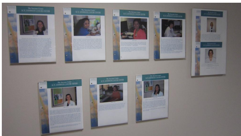
サルコーマセンターのスタッフの紹介コーナー