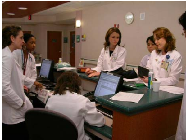
乳腺病棟のチーム回診の様様

ベッドサイドでの医師・上級看護師・看護師・薬剤師からなるチームによる回診は、想像と大きく異なっていた。時間・空間・情報を共有しながら回診し、互いに考えを述べ合って治療方針を決定していく過程は非常に理想的であった。回診中には薬については薬剤師が、患者さんやその家族についての背景については看護師が情報をチームに提供することで、患者さんが中心にいて周りに多職種が寄り添う形のチーム医療が行われている印象を受けた。チームで