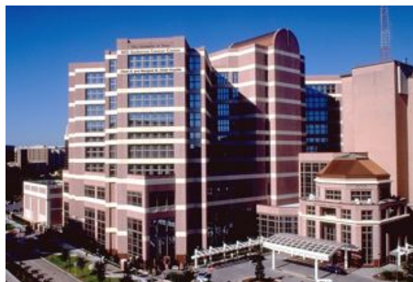
Alkek Hospital(入院病棟)。M.D.アンダーソンは、テキサス・メディカルセンターの中にあつて、Alkek Hospital や Clark Clinic など、多数の施設から構成されている

ともかく、世界で一番のがん病院だという誇りを感じ、世界中から訪れる見学者に対しても惜しみなく様々なことを教えようとする気風を感じた。MDA は私に臨床と研究の両方を追及していくことは可能なのだと教えてくれたと思う。