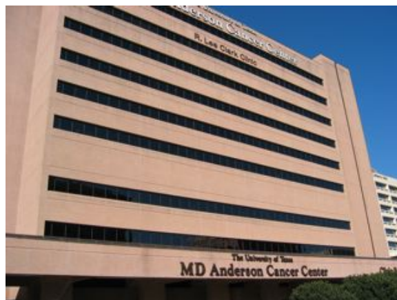
Clark Clinic (外来病棟)