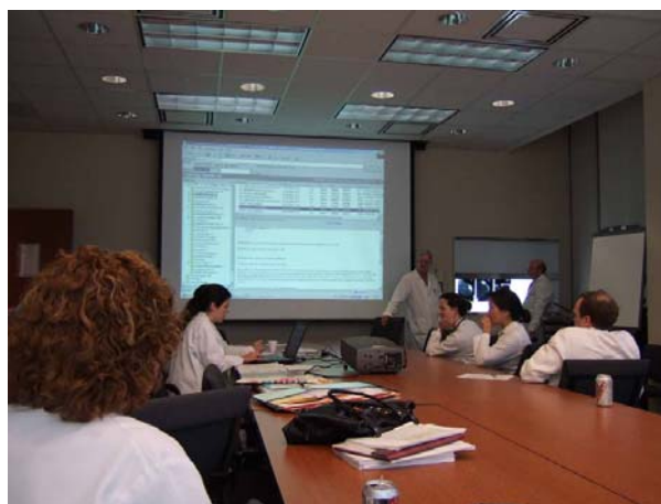
“Multidisciplinary Conference” 外科・腫瘍内科・放射線科医師、看護師、薬剤師などが参加する

Multidisciplinary Breast Conference を一度見学し、こうした多部門が集まる定期的なカンファレンスが開催されているということに驚いた。日本でもこうした取り組みは Cancer Board という名で始まっているが、実効が上がるのは当分の間無理だと感じた。なぜなら第一に、学生目で見ても明らかなように、診療科を超えたコミュニケーションがうまく取れていない。一度自分の科で診療を始めた患者さんは「自分の」患者さんであり、他の科の介入の余地はあま