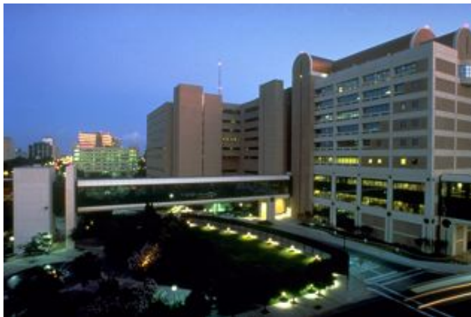
MDAのClark Clinic (外来病棟)。M.D.アンダーソンは、テキサス・メディカルセンターの中にあつて、Clark ClinicやAlkek Hospitalなど、多数の施設から構成されている