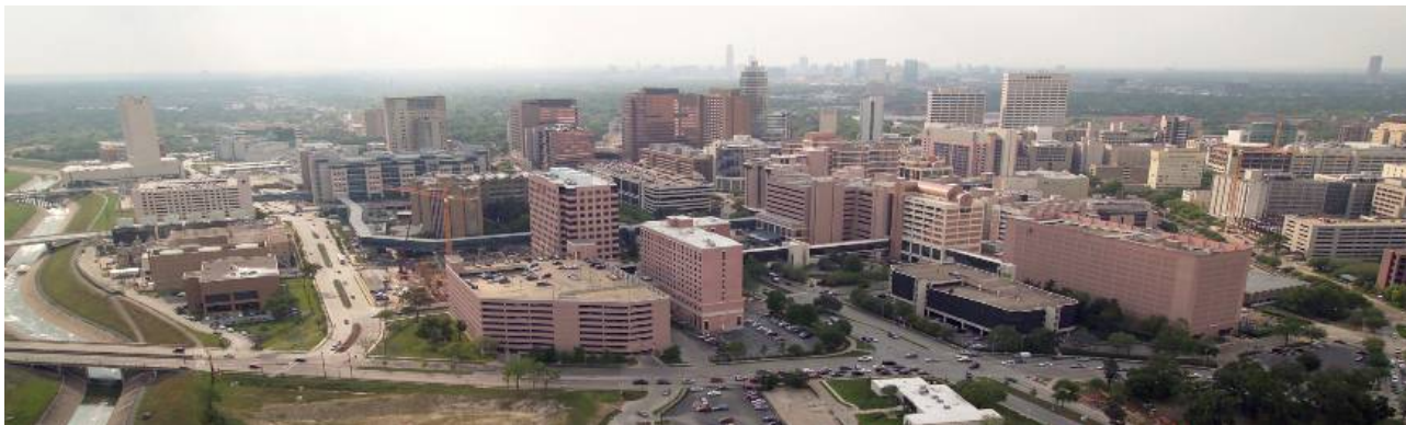
テキサス・メディカルセンター。MDA(手前中央)のほか、42の医療施設が集まった世界最大の医療センター

には電動カートが走っており、これに乗ってスタッフも移動できるが、患者さん優先。太った人がよく乗っている傾向にあるように思う。