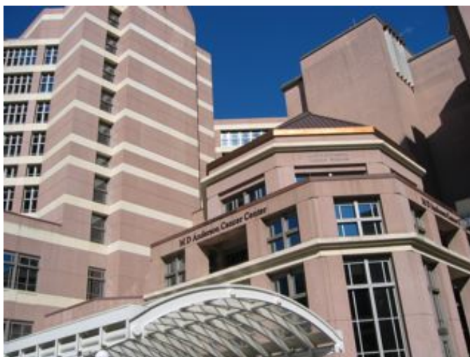
MDA の Alkek Hospital (入院病棟)