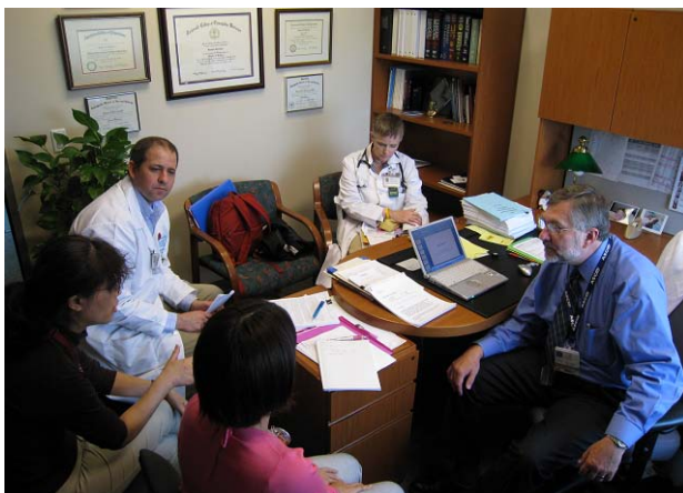
メンターとプロジェクトについてミーティング