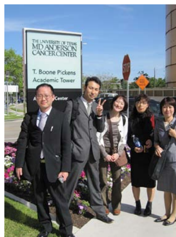
Pickens Tower 入り口前