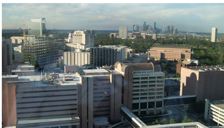
Pickens Tower 20階から見たMDAのMain Building

その後、上野先生から今回の研修のチャレンジ、最終日のプレゼンテーションについてのお話があった。