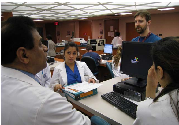
Palliative Care 病棟の回診